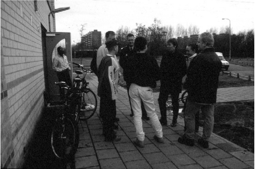
Jongeren stimuleren om een actieve rol te spelen in de eigen leefomgeving

natuurlijk ook van jongeren horen hoe zij over bepaalde onderwerpen dachten. Er kwam dus van alles aan bod. Discriminatie in de horeca was bijvoorbeeld iets waar veel jongeren mee zaten. Als je verkeerde schoenen aanhad of als je een andere huidskleur had, kon de toegang je geweigerd worden. Dat heeft ertoe geleid dat er binnen drie maanden een meldpunt kwam en het onderwerp is meegenomen in een horecaconvenant. Andere items die op een later tijdstip en in een andere setting zijn uitgediept, gingen over waarden en normen, voorzieningen, potenties en opvoeding.'